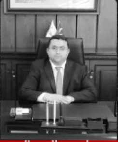
HÜSNÜ ÇELİK HATAY